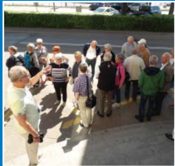
Ordergivning i Helsingör. Framåt mot Sjöfartsmuséet