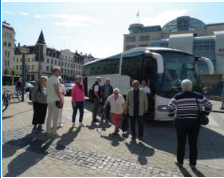
Framme i Helsingborg vid knutpunkten