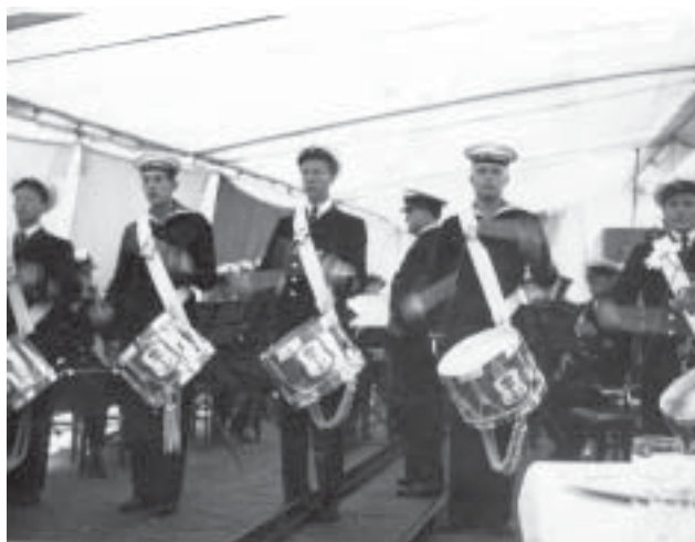
Trumslagare på Tre Kronor

na, som regementstrumslagarna kallas i flottan, satt sin prägel på kåren.