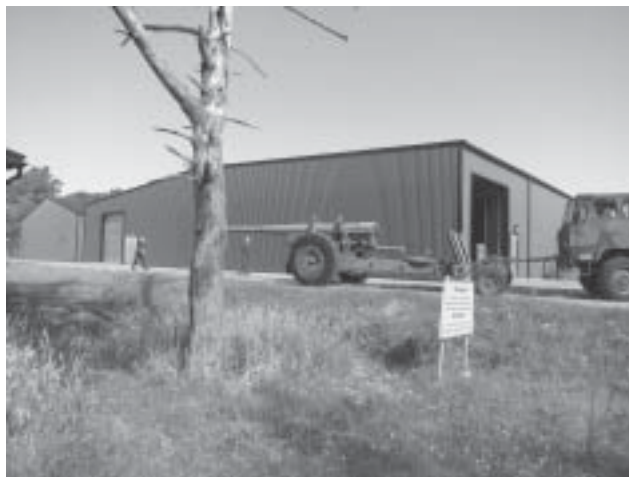
Nosning av pjäs