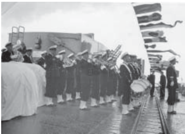
Flottans Musikkår ombord på kryssaren Tre Kronor vid örlogsbesök i England