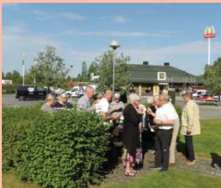
Morgonkaffe serverades vid McDonalds i Hässleholm.