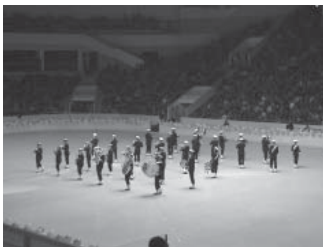
Marinens Musikkår i ett figurativt program i samband med besök i Sankt Petersburg

Sedan den 1 juli 1994 ingår musikkåren i Försvarmusikcentrum vars ledning finns i Kungsängen. Förutom sina militära tjänsteuppdrag, har musikkåren en omfattande konsertverksamhet med en mycket bred repertoar i olika genrer, allt för att möta en ny publik och för att skapa nytänkande. Marinens Musikkår har en nyckelroll