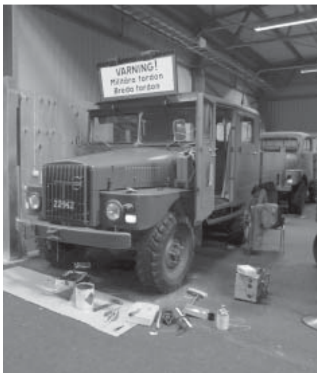
En nästan färdigmålad terrängbil 938