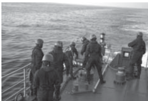
Sjöminan lämnar avlöpningsbanan för att finna sin plats på botten.