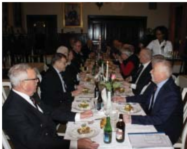
Förrätten klar att avnjutas