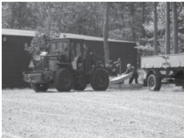
Bengt hjälper till att ta bort förankringarna till presentationen som täckt 21an

Med hjälp av två specialister från Ericsson kunde STRİKA-systemen åtgärdas. De felaktiga bildenheterna i SL 1 och BLC byttes ut liksom felaktiga bandspelare. De er-