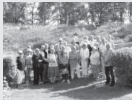
KA 2-kamrater möter våren.