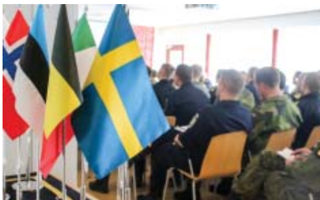
Några av nationsflaggorna med övningsdeltagare i bakgrunden

dinarie verksamhet på Sjöstridsskolan ska kunna fortgå som vanligt.