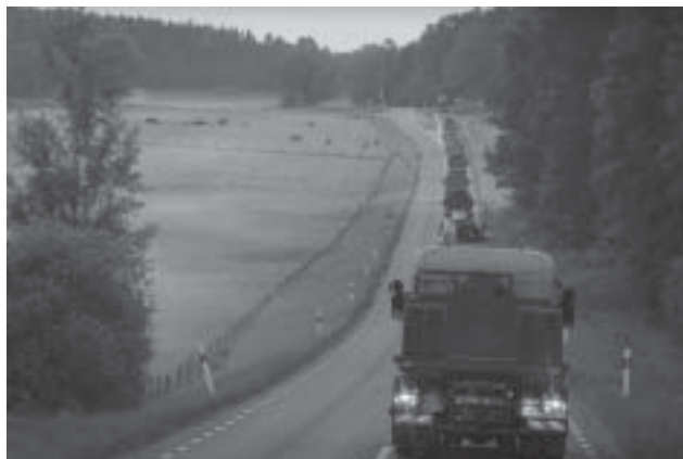
Genom ett vackert landskap går fordonskolonnen mot platsen där den viktiga lasten ska hämtas.