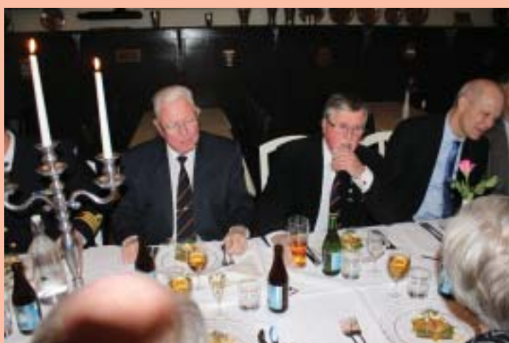
Samtal utbytes över bordet.