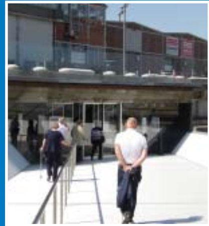
Nedgången till sjöfartsmuséet