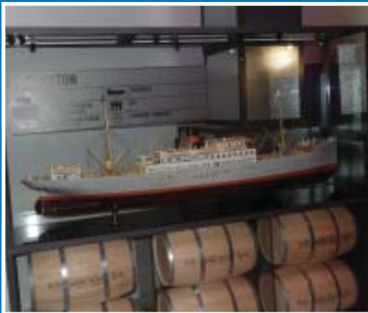
Det finns många fartygsmodeller i muséet