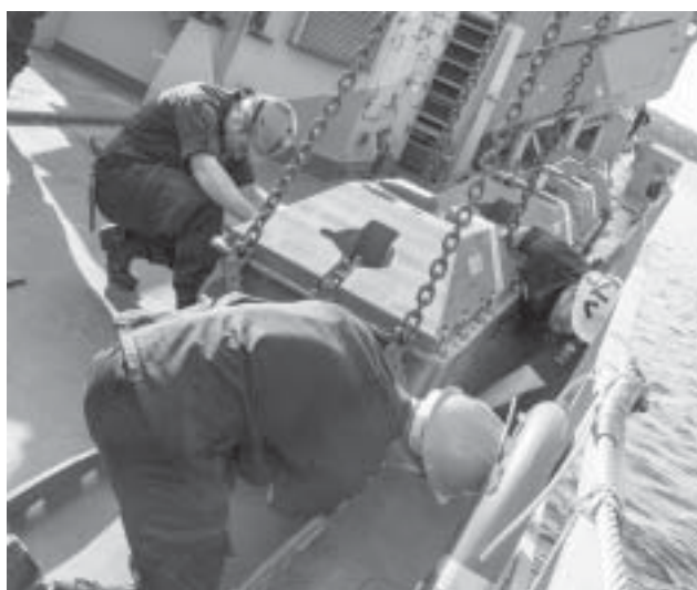
Sjöminan lastas och surras på minrälsen.