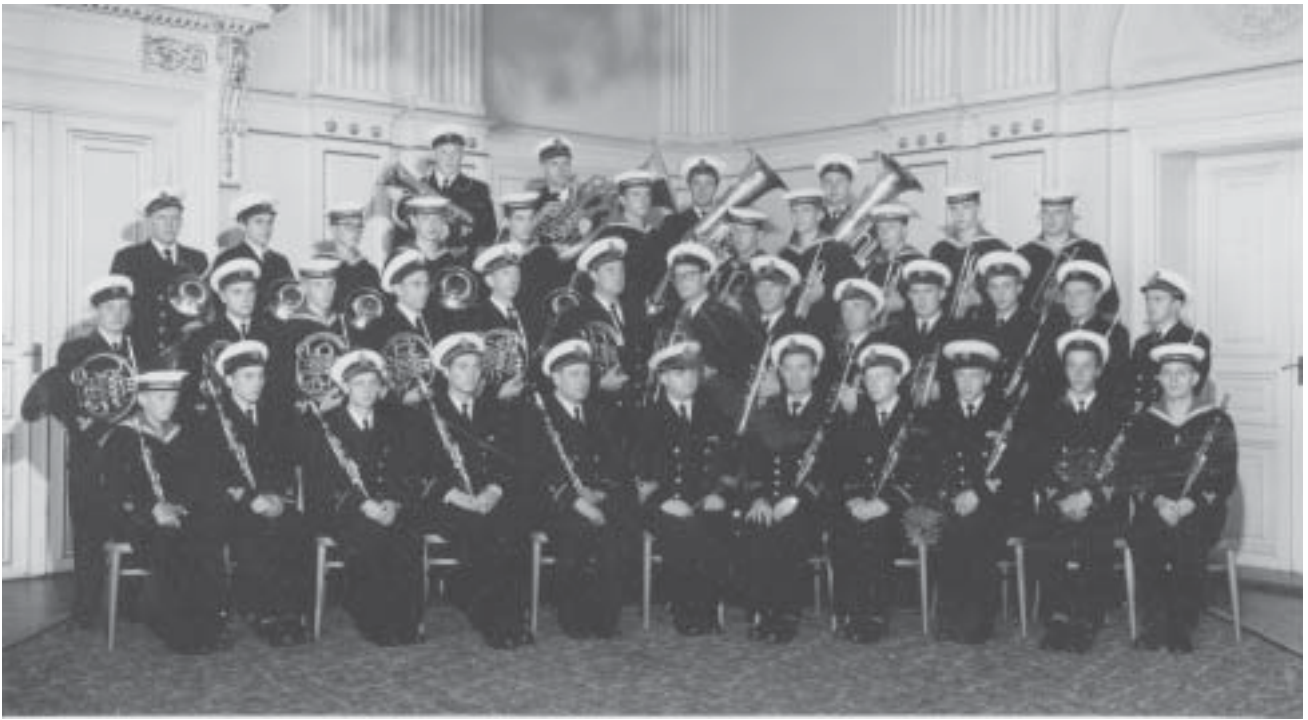
Flottans Musikkår Stadshotellet Karlskrona september 1953.