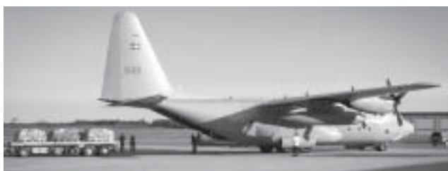
Minorna lastades på speciella lastflak och rullades ombord på flygplanet.