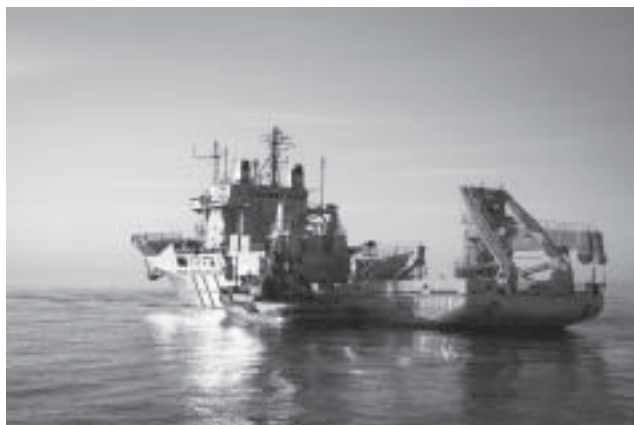
HMS Hector har kopplat sig mot HMS Belos och tränar på att förflytta fartyget i olika riktningar.

Bogserbåtarna har också rejäl dragkapacitet och kan bogsera de flesta stora fartyg. Just den här dagen hade båda fartygen, HMS Hercules och HMS Hector möjlighet att befinna sig på samma plats som fartyget HMS Belos för att fritt till havs passa på att verifiera de teorier man hade om hur man skulle kunna använda bogserarna. Syftet var att genomföra en mängd olika moment där man på varierande sätt assisterar, förhalar och bogserar ett fartyg i ett hamnområde eller genom trånga passager. Fördelen med att göra detta långt ute till havs var att man kunde ha fritt manöverutrymme.