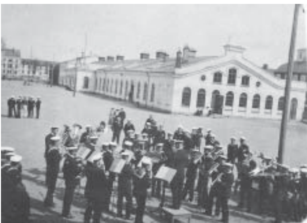
Flottans Musikkår ger konsert på Sparres kaserngård förmodligen på 1920-talet

Förutom musikdirektörerna har även flaggtrumslaga-