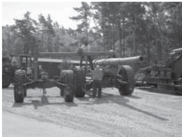
Så ska traversvagnen på plats och kopplas till eldröret