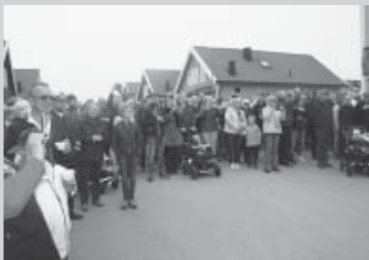
Morgonpigga karlskronabor följde traditionsenligt musikkåren runt staden