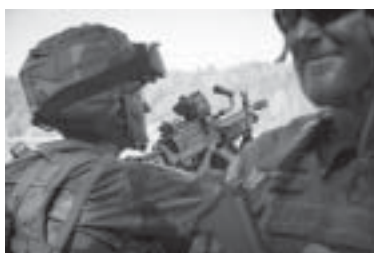
Soldater skyddar platsen där lastning sker.