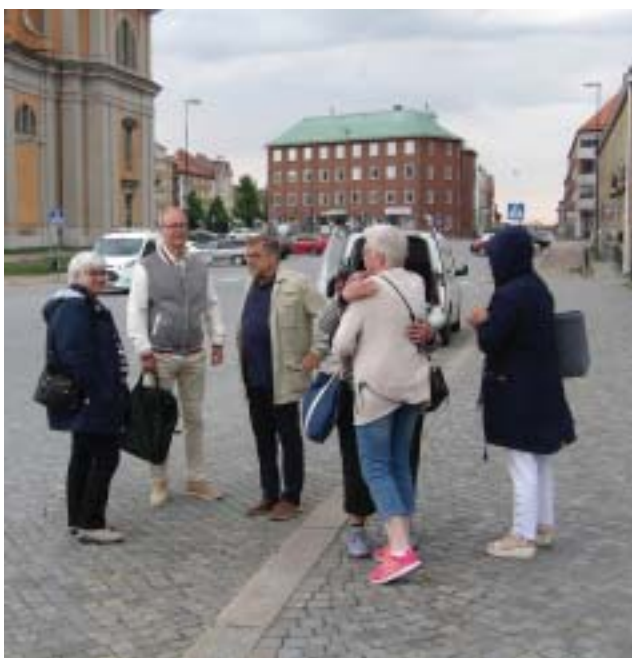
Morgonpigga resenärer på Stortorget i väntan på bussen