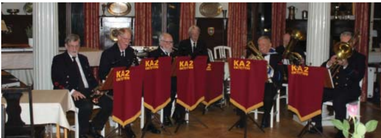
KA 2 Oktetten underhåller under samlingen.