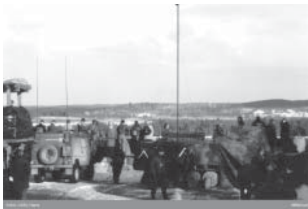
Observationsplats O 7