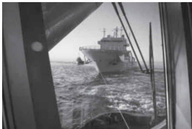
Vi det här tillfället passade man på att pröva så många olika möjligheter man kunde. Båda fartygen fick turas om att dra i vardera änden av fartyget.