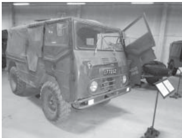
Pltgbil 903 kallad valpen