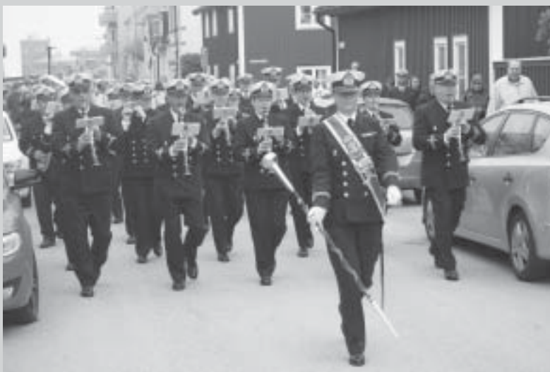
På väg till Björkholmen och den väntade blåbärssoppan